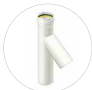
Absturzabzweig DN 160 und 200