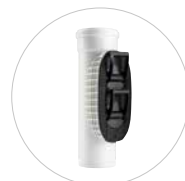
POLO-EHP Control DN 110-630