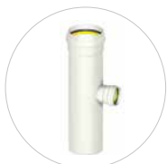
Prüfabzweig DN 160-630 45° und 90°