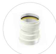
Doppel- und Überschiebmuffe DN 110-630