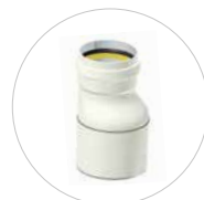
Übergangrohr DN 110-630