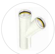
Abzweig DN 110-630 45° und 90°