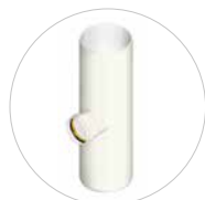
Sohgleicher Abzweig DN 315-630