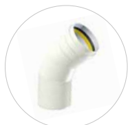
Bogen DN 110-630 7,5 - 87,5°