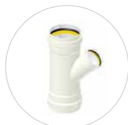
Dreimuffenabzweig DN 160-500